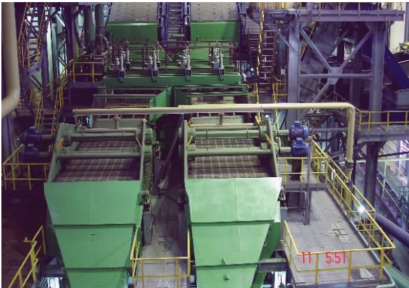
BATAC® & ROMJIG® | Setzmaschine