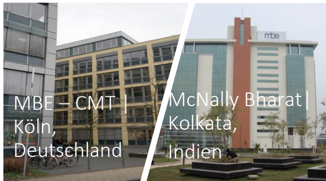
MBE – CMT Köln, Deutschland