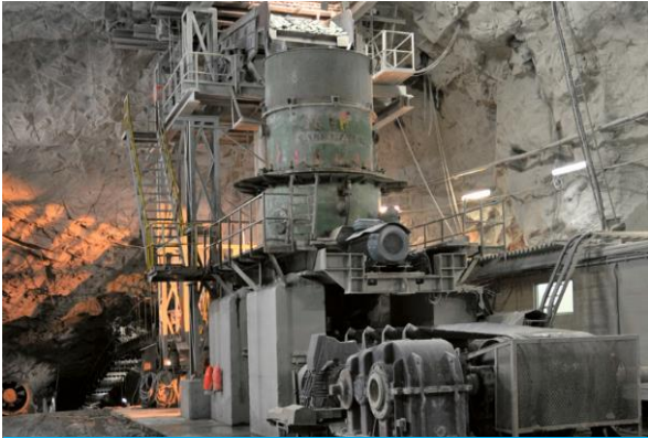
BRECHER & SIEBE