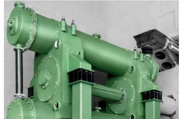
PALLA® | Vibration-Mühle