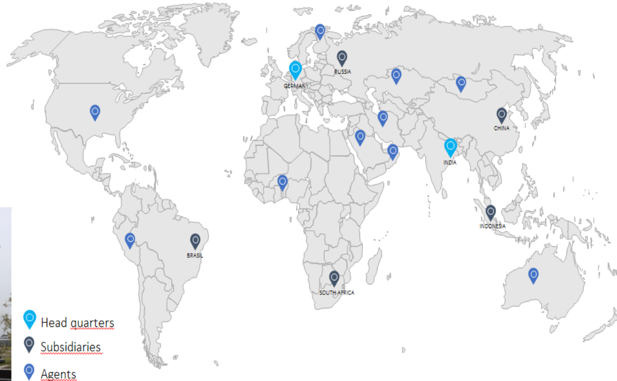
McNally Bharat | Kolkata, Indien

MBE CMT entwirft sowohl komplette Anlagen als auch Systeme zur Ergänzung oder Modifikation bestehender Anlagen. Wir begleiten unseren Kunden von der ersten Beratung bis zur Inbetriebnahme. Wir setzen genau die Mitarbeiter ein, die auf die jeweilige Technologie spezialisiert sind .