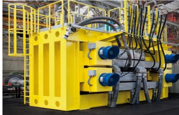
JONES® & PERMOS® | Magnetscheider