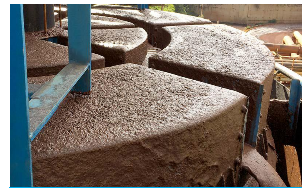
PNEUFLOT® | Pneumatische Flotation