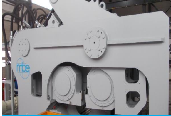
ROOLLSTAR® | Rollenpresse