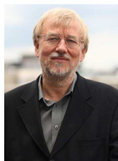
Jakob von Uexküll WFC-Gründer und Vorstandsvorsitzender